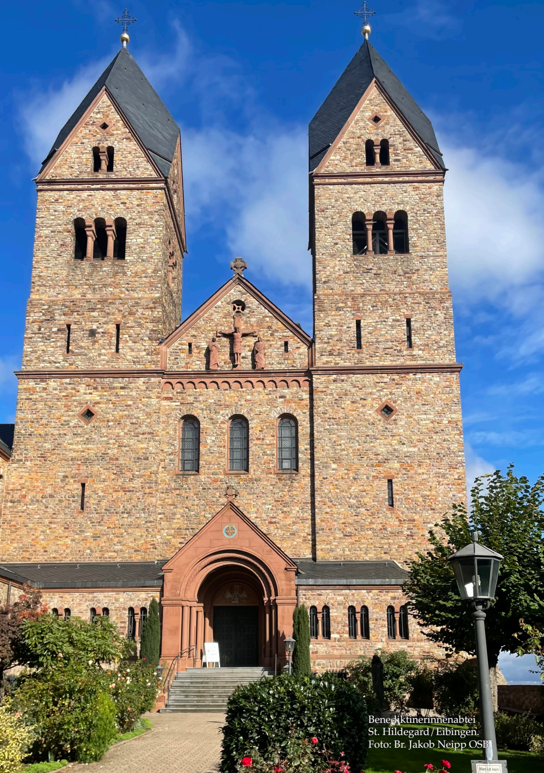
Benediktinerinnenabtei St. Hildegard / Eibingen.